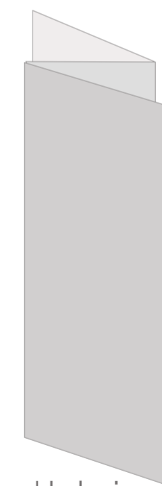
składanie na 3 Z